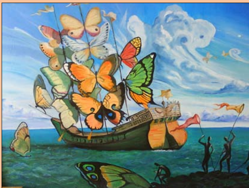
Salvador Dalí: Pillangós hajó

A csap vizet iszik, a csengő csöngetést, kémény füstöt beszív, almát ragaszt a kés.