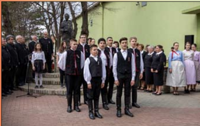
A szavalók – Dicsőséges nagyurak...