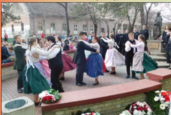
A néptáncosok és a lelkes közönség