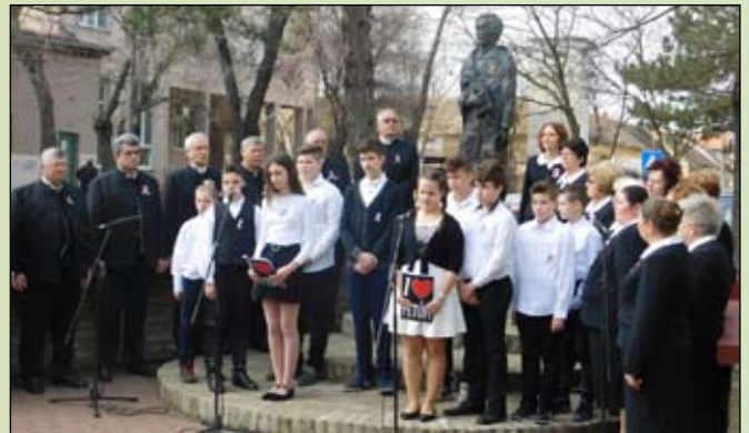
Emlékeznek a diákok