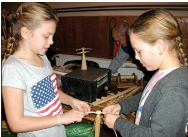
Készül a táncoló baba