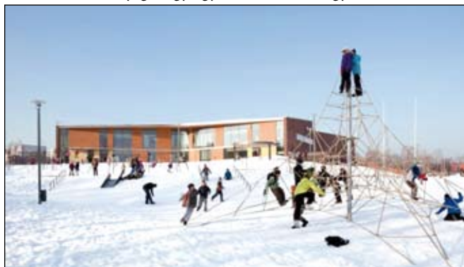
Az iskolaudvaron szabadjára mozoghat mindenki