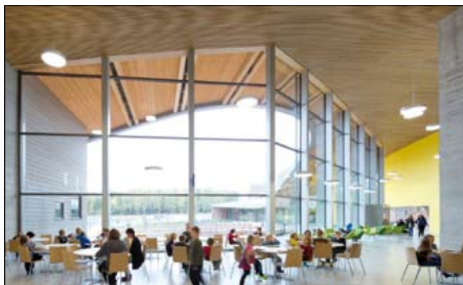
Szembetűnő, hogy alig van belső fal