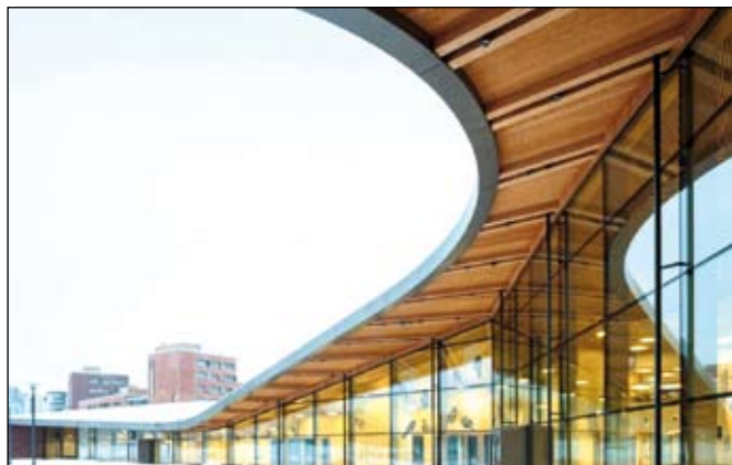
Az iskolaépületet meleg színek és a természetközelség jellemzi

Az iskola színeit illetően a tervezők a minél barátságosabb, világos színösszetételekre törekedtek, amelyek hozzájárulnak a tanuláshoz és beszélgetésekhez alkalmas légkör megteremtéséhez. Nagy ablakokat is beépítettek, amelyek szintén a gyerekek komfortérzetét szolgálják.