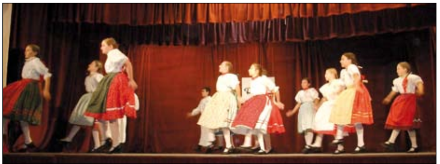
A temerini Recefcice együttes

rini Cifra , a zentai Zenta , az óbecsei Kiscimbo-ra és Csiperke néptánc együttes fellépése következett. Kísért az óbecsei Fokos zenekar.