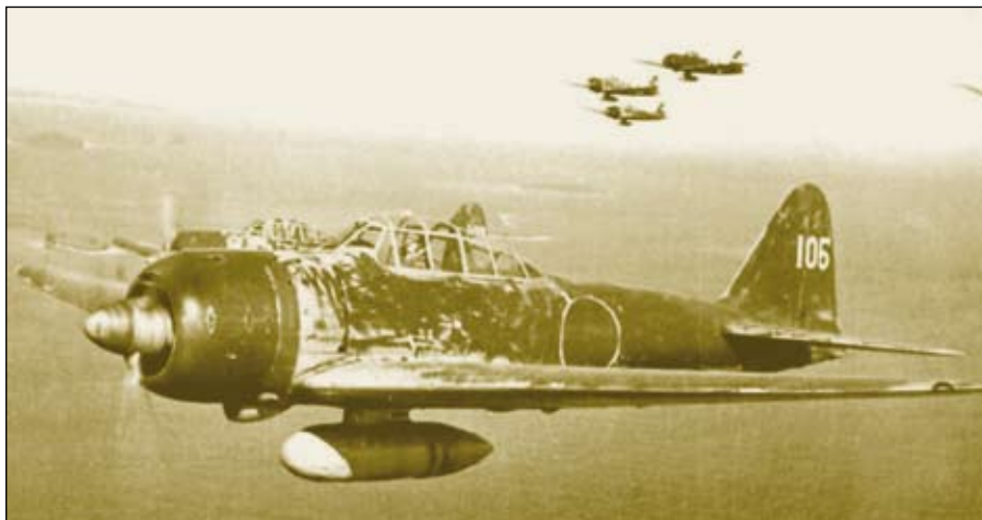
Hadviselt, kopott, külső üzemanyagtartállyal ellátott Zero

A cég főmérnöke szerint a legnagyobb problémát a gép tömege jelentette, ezért arra törekedett, hogy minél könnyebb szerkezetet tervezzen, mert a rendelkezésre álló motor képtelen volt nagy tömeget gyorsan és messzire cipelni. A törzs és a szárnyak borítására igen szilárd, de könnyű anyagokat használt, és folyton a feleslegesnek mutatóalkatrészek kihagyására törekedett. Ezt olykor eltűnt, csúcspontja pedig az volt, amikor a pilótát védő páncéllemezt is kihagyta terveiből. Mindennek köszönhetően sikerült a gép súlyát annyira csökkenteni, hogy a fegyverzetet ne kelljen takarékoskodni. A Zerót két 7,7 mm-es géppuskával, valamint két 20 mm-es gépágyúval fegyverezték fel. Ráadásul a repülőgépre külső üzemanyagtartályt is szerelhetek, így hatótávolsága 3100 km-t tett ki.