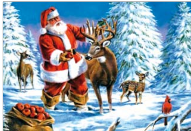
A kedves, ajándékozó Mikulást általában ilyennek képzeljük és látjuk

A Mikulás mellől nem hiányozhatnak a krampuszok, azaz a segédek, akikre azért van szükség, mert ők hozzák a büntetést (a virgácsot) a rossz gyerekeknek. Általában ördög formájúak, vörös vagy fekete színűek, fejükön szarvakat viselnek, és az esetek nagy többségében hosszú, bojtos farkuk van.