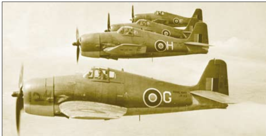
Harcba induló Hellcatok

A Zeró ideje lejárt, a háború végéig többnyire öngyilkos támadásokra használták őket.