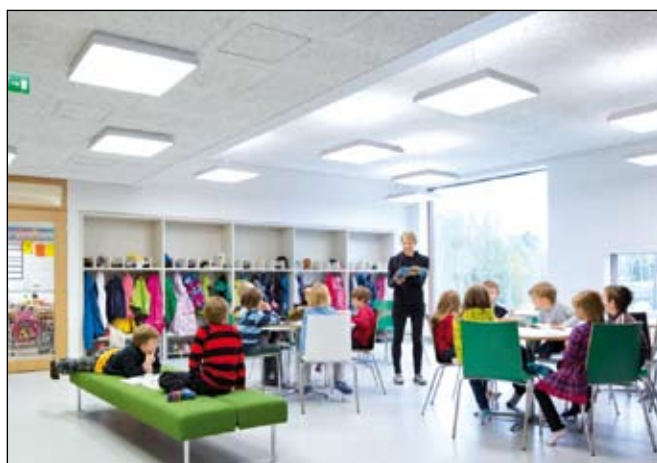
Az iskolapadok mellett kanapék is vannak, akinek elfárad a dereka, leheveredhet