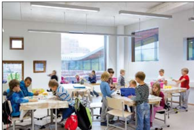
A táblát a laptopok helyettesítik, a házi feladatok is rendszerint csoportos tevékenységeket jelentenek