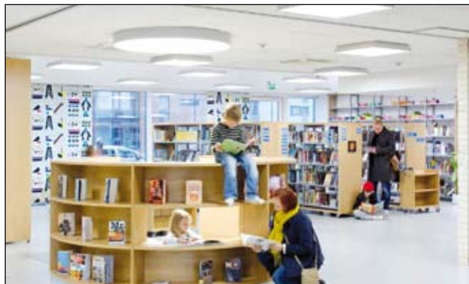
Könyvtárosa nincs szükség, azt vesznek el az olvasók, amit akarnak, a lényeg, hogy ugyanoda vissza is tegyék