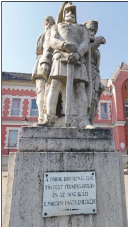
A második mohácsi csata emlékműve

Mivel a Dráva fahídja több mint nyolc kilométeren keresztül vezetett át a mocsáron, a keresztény erők kockázatosnak találták a támadást ezen a bizonytalan terepen, ám mindenképpen ki akarták használni a török jelenlétét, hogy ismét elporolhassák. Ekkor lépett színre Savoyai Jenő, akinek körmönfonságért, furfangért sohasem kellett a szomszédba mennie.