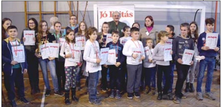
A Palicson megtartott torna díjazottjai

021/457-100, valamint a 064/80-55-153 telefonszámon.