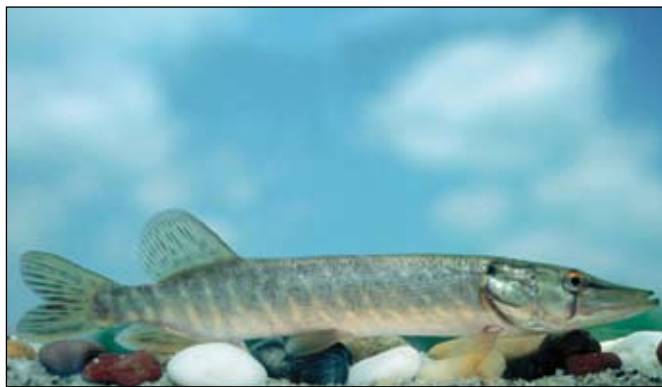
1. Csuka (Esox lucius)

Most jöhetnek Az év hala címre pályázók.