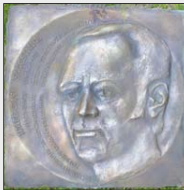
A Szűcs Imre-emléktábla