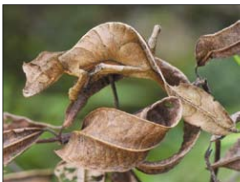
A gekkó az álcázás nagymestere

Az állatvilágban mindennaposak az életre-halálra menő küzdelmek: a ragadozók az éhhál ellen és nem ritkán más ragadozók ellen is küzdenek, míg mások elsősorban a rájuk leselkedő veszély ellen „öltenek” álsruhát. Ezt a túlélési stratégiát mimikrinek nevezzük: egyes állatok olyannyira hasonlítanak a környezetükre, hogy akár falevélnék vagy faágnak, kéregnek is tűnhetnek.