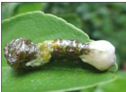
Madárpottyintást mímelő hernyó

Egészen különleges példája a mimikrinek, hogy néhány lepkefaj hernyója nem növénynek, nem is valami veszélyes ragadozónak, de egyenesen madárürüléknek „álcázza magát”. Noha ezzel teljesen elüt a zöld környezetétől és nagyon is szembetűnő, a madárürülék nem tartozik a hernyóra veszélyt jelentő madarak „étlapjára”.