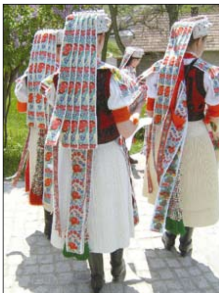
Körösői lányok pártában – A férjhezmenetel előtt álló lányok a lakodalomig viselték a pártát, amit csak akkor tehettek le, amikor kimondták a boldogító igent

a pártában maradt lányok ellen irányult. Azok ellen, akik a közmegítélés szerint nem tettek eleget kötelességüknek. A csúfolódó szokások olykor kegyetlen humorral veszik célba a vénlányokat. Lényegében e témára épült Csokonai Dorottyája is. A vénlánycsúfolásra utal a tuskóhúzás szokása is. Csokonai így számol be erről a Dorottyához írt jegyzetben: „Tökét vonni. Szokásban vagyon sok helyeken, hogy mikor a farsáng elmúlik, a meg nem házasodott ifjakkal és a férjhez nem ment leányokkal valamely fát vagy tökét neveltség okáért felemeltetnek, vagy egy helyről más helyre vitetnek. A csinosabbak az olyan személynek zsebébe egy kis forgácsot, szilánkot vagy zsindelet tesznek, sőt affélett levelekbe s cédulákba is zárnak.” Dugonics András piarista szerzetes is szól a tuskóhúzás szokásáról: „Régenten azokkal az eladó lányokkal, kik farsangi napokon férjhez nem mentenek, mint valami szilaj kancákkal hus hagyó Szerdán tökét huzattak a Magyarok.”