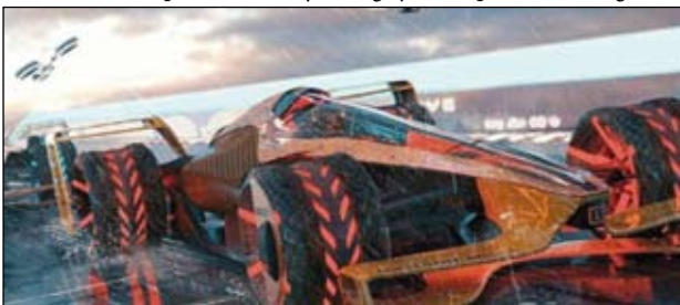
A szenzorok teljesen új dolgokat mutathatnak meg a nézőknek

Minden egyes versenyautó több mint 200 szenzorral van felszerelve, amelyek folyamatosan mérik a legfontosabb tesztadatokat. A szakértő rámutatott, hogy egy másfél órás futam során kerekken 250 000 gigabájt adat keletkezik. Ekkora adatmennyiség valós idejű feldolgozását egyedül a felhőkörnyezetben lévő számítási teljesítmény teszi lehetővé. Ezen elemzések alapján például az egyes versenyek alatt kiszámíthatók a boxkiállások és a kerécserek optimális időablakai. Precízen kiértékelhető a versenyzők teljesítménye. A szakemberek előrejelzéseket akarnak kínálni a taktikai manőverekkel és az egyes istállóknak, illetve a pilóták versenystratégiájával kapcsolatban. (sg.hu)