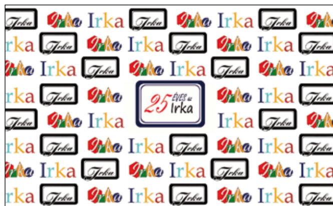
Az Irka még „csak” 25 éves