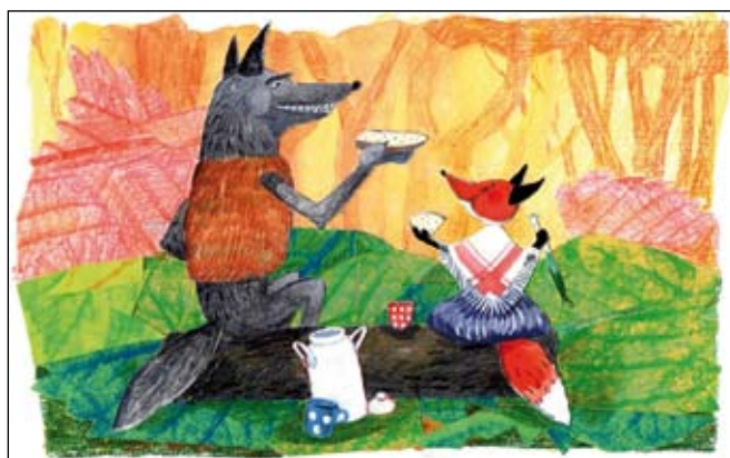
Illusztrációkban nincs hiány a kárpátaljai gyereknapban