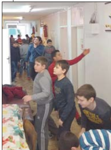
Munkában a fiúk...

Valentin-nap előtt egy héttel iskolánk diákszemélyiségei, köztük én is, gyűlést tartottak a Valentin-napi programokról. Megbeszéltük az esemény időpontját, a terveket és a tennivalókat.