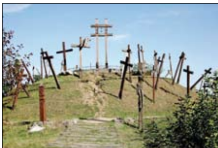
A muhi csata emlékműve

A csata jelentősége: A csata után védtelenül maradt Magyarország, melyet így feldúlt a hatalmas mongol haderő.