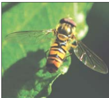
A zengőlegyek is próbálnak a darazsra hasonlítani, de ezzel nincsenek egyedül

A mimikri mindannyiunk által ismert formája a rejtő színezet, amelyet a békáktól kezdve a madarakon át egészen az őzgidáig