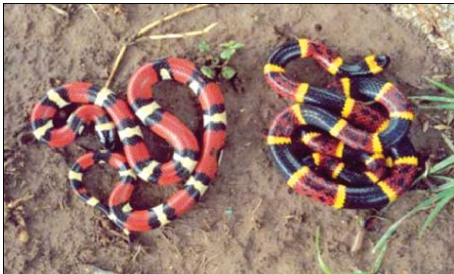
Az „ártalmatlan” és a mérges kígyó esete, balról korallsikló, jobbról korallkígyó

Előfordulhat az is, hogy az állatok nem a környezetükbe szeretnének beleolvadni, hanem valamilyen mérgező, veszélyes állatnak „álcázzák magukat”. Erre példaként felsorolhatnánk egyes siklókat, amelyek ugyan nem mérgezőek, de színezetükben a megtévesztésig hasonlítanak a halálos mérgű kígyókra. Bizonyos legyek szintén harsányan csikozottak, amivel együtt nagy hasonlóságot mutatnak például a darazsakhoz – így a küllemükkel ezek az állatok már messziről azt a „jelzést” küldik a madarak, ragadozók felé, hogy „nem adják egyikőnnyen az életüket”.