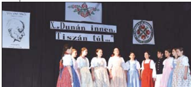
Az óbecsei Csicsörke énekcsoport is továbbjutott a miskolci döntőbe