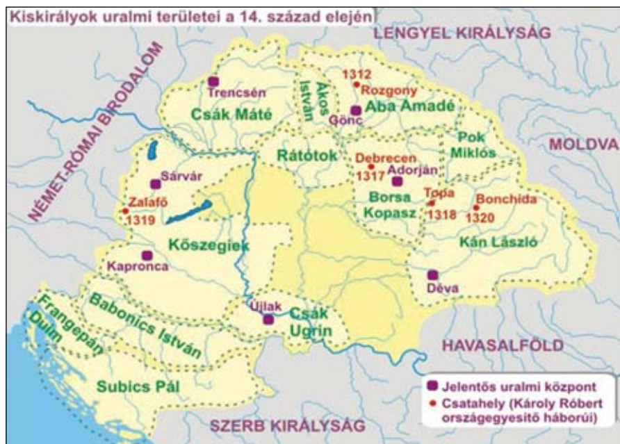
Kiskirályok uralmi területei a XIV. században

A csata jelentősége: A rozgonyi csata után jelentősen megnőtt a király tekintélye: csapatai egymás után foglalták el az Amadé-fiak kezén lévő várakat, és uralmát az ország északkeleti felén a lengyel határig terjesztette ki. A legnagyobb ellenfélnek tekintett Csák Máté katonai erejét a csatavesztés nem törte meg, de a keleti irányú terjeszkedés lehetőségét lezárta előtte, így hatalma hanyatlani kezdett. Károly Róbert lassan, de biztosan megszerezte az egész ország feletti ellenőrzést.