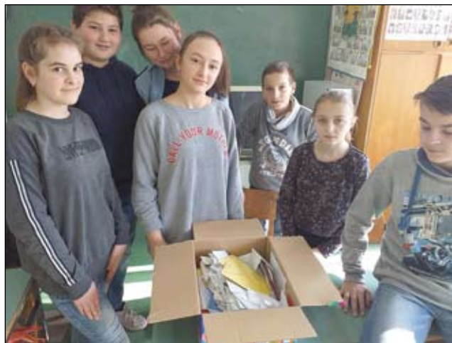
Négy napon át gyűltek a levelek

mértani alakzatokkal. Különböző dolgokat, főleg állatokat kellett kirakni belőle. 2 fordulót tartottunk, az első fordulóban osztályonként versenyeztünk (akik akartak, de maximum nyolcan versenyezhet-