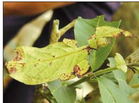
A vándorló levelek nemcsak küllemükben, de mozgásukban is a ringatózó levelekre hasonlítanak

A mimikri mindannyiunk által ismert formája a rejtő színezet, amelyet a békáktól kezdve a madarakon át egészen az őzgidáig