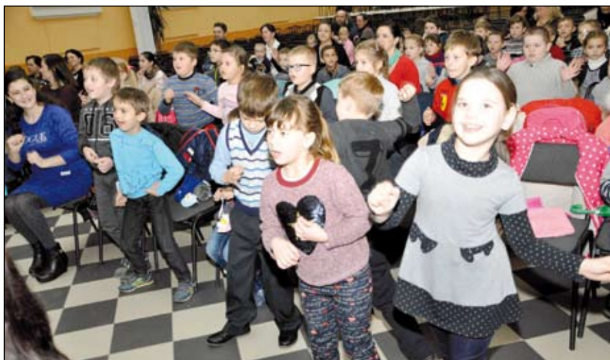
Egy irkás gyermeknap hangulata