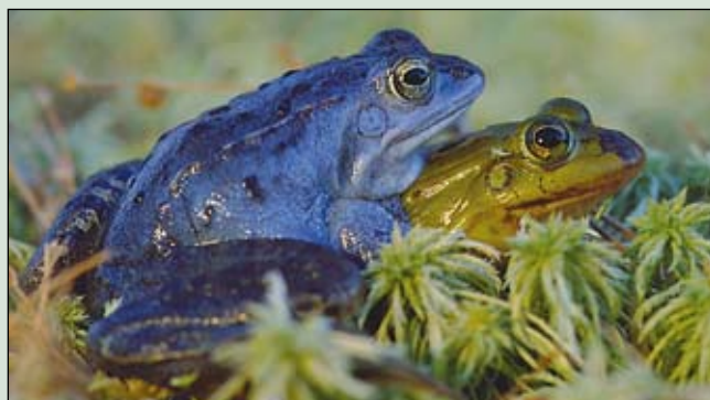
A mocsári béka hímje a nász során rövid időre égszínkékké változik

Ha márciusban a vizek mentén sétálgatunk, egyszerre látjuk a bú- csúzó tél és a kora tavasz legkülönbözőbb jeleit. A folyókon és az állóví- zekben még a télire érkezett madárvendégek úsznak, de már zöldellnek a parti fűzfák, gágogva repülnek a február végén érkezett nyárilúdpá- rok, a nádasok mélyén bölömbika bummog, és a szintén korán érkezett nagy kócsagok már a fészkeléshez készülődnek. Előbújtak a kételtűek is. Gyepi, mocsári és erdei békák, valamint barna varangyok érkeznek a kiöntésekhez, sekély tószegélyekhez, kubikgödörkhöz, hogy peté- iket lerakják. A gyepi békák nyitják a sort, nemegyszer már február végén megjelennek, és március elején már nagy petecsomóik úsznak a vízben. A hím és a nőstény párzás közben néha vartyogó hangon