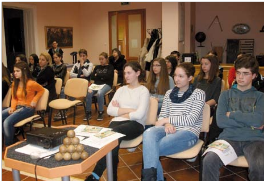
A közönség, a nyolcadikosok