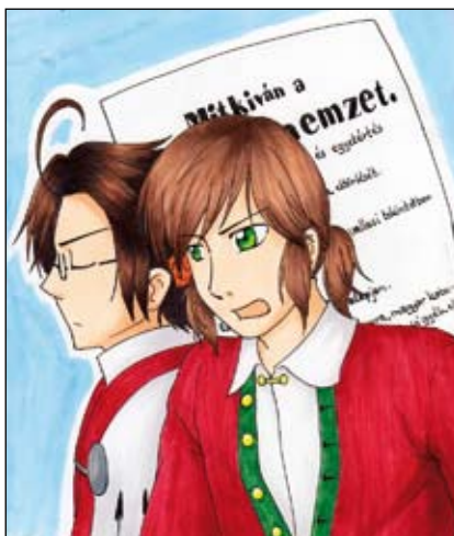
Kurokawa Ayumi mai szemmel így látja a 12 pontot (Devian Art)

* A pesti városháza elé vonultak, és a városi tanáccsal elfogadtatták a tizenkét pontot. Így a petíció mint Pest város követelése mehetett Pozsonyba.