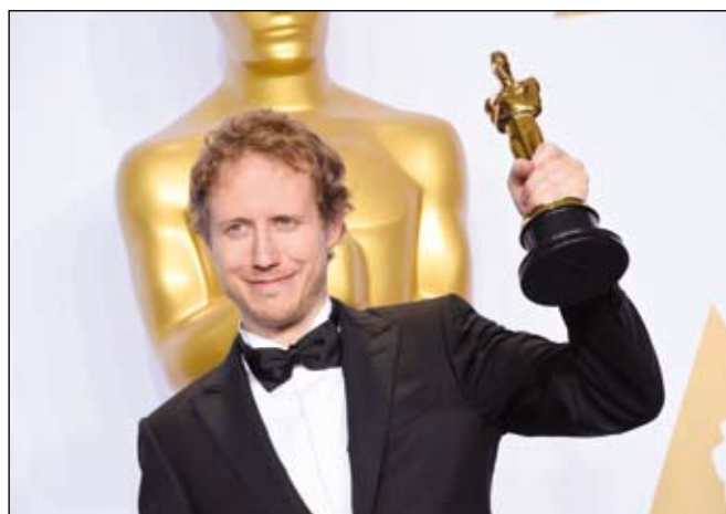
Nemes Jeles László