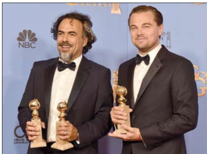
Alejandro G. Inárritu és Leonardo DiCaprio

Legjobb smink: Mad Max: A harag útja Legjobb operatőr: Emmanuel Lubezki – A visszatérő Legjobb vágás: Mad Max: A harag útja Legjobb hangvágás: Mad Max: A harag útja Legjobb hangkeverés: Mad Max: A harag útja Legjobb vizuális effektek: Ex Machina Legjobb animációs rövidfilm: Bear story (chilei animáció) Legjobb animációs film: Agymanók