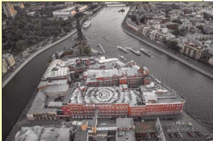
Ez a világ legnagyobb kalligrafitije, azaz szépírással rajzolt graffitije. Megalkotója a világhírű orosz Pokras Lampas, és a mű egy tetőn díszelg

A régi írások ecsettel rizspapírra és selyemre írtak. A klasszikus írókészlet ecsetből, tintából, különleges, vékony papírból, nehezebből és egy alátétként szolgáló puha írólapból állt.