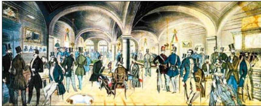
Gyülekezés a Pilvaxban

* A Nemzeti Múzeum előtt nagygyűlést tartottak.