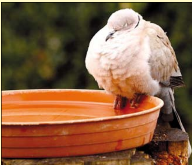
Szunyókáló balkáni gerle

Azért, mert a karmaikkal biztonságosan kapaszkodnak. Az ágon A ülve hátsó karmaikat behajlítják, így lábaikban az inak megfe- szülnek, karmaik pedig bezáródnak. A madarak karmaiban a fogóref- lex automatikus. Az embernek meg kell feszítenie az izmait, amikor valamit meg akar fogni, a madár viszont akkor használja az izomere- jét, amikor elenged valamit. A fogás az embernél cselekvés, a madár- nál azonban egy passzív állapot.