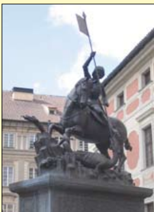
A sárkányölő Szent György-szobor Prágában és Kolozsváron

középkori művészet egy korai körplasztikája, vagyis minden oldalról