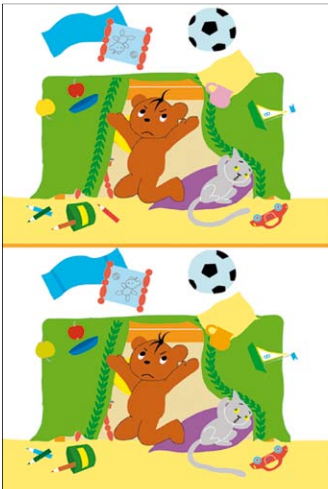
Keresd meg a 10 különbséget a képek között!

E mögött valójában az a logikai tétel húzódik, miszerint nem(nem[igaz]) = igaz, hiszen ha igaznak a jó ajtót nevezem, akkor mindkettejükkel pontosan kétszer tagadtatom az igaz ajtót, amiből biztosan a helyes választ kapom.