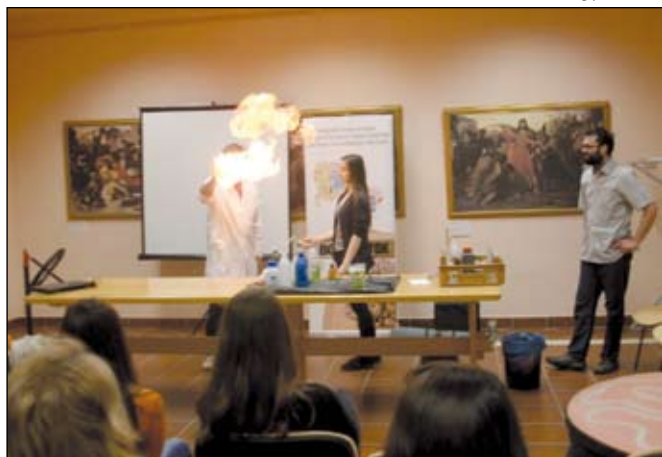
A tanár keze lángol