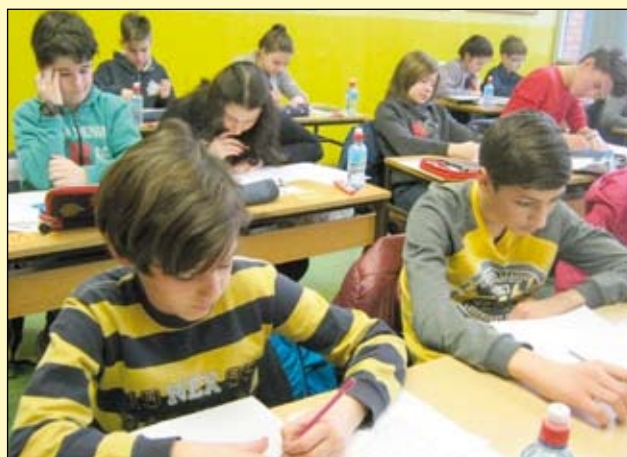
A. I., A. D.

Képünkön nagy munkában a kis matematikusok.