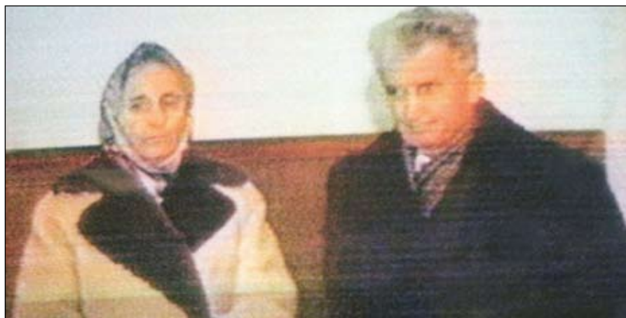
A diktátor és feleségének a kivégzése